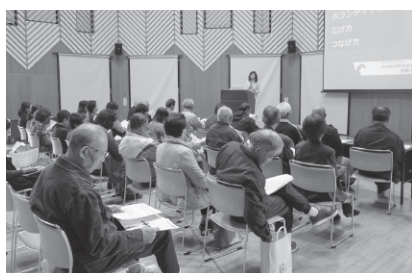
ボランティア研修会