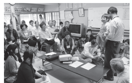
日本地域福祉学会熊本大会前日企画